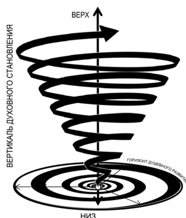
Рис. 4. Соотношение процессов духовного становления и душевного развития

А соединение душевной составляющей «спиралевидного движения в горизонтальной плоскости», которое заметила М.В. Захарченко, в соединении с вертикальным духовным становлением, о котором говорит о. Георгий (Шестун), можно изобразить в виде спиралевидного конуса восхождения человека (рис. 4) к образу совершенства, о котором говорит нам Спаситель – «будьте совершенны» (Мф. 5: 48).