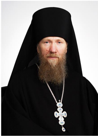
архимандрит Платон (Игумнов)

ного и Божественного. <...> Его жизнь протекает одновременно в трёх сферах бытия — природной, социально-культурной и религиозной... личность ориентирована на своё собственное бытие, на этическое отношение к миру и на религиозное отношение к Богу» 36 .