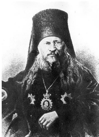
архиепископ Евсевий (Орлинский)

Православное мировоззрение, основанное на методологии антиномизма, которая лежит в фундаменте большинства христианских догматов (от догмата о Святой Троице и догмата о двуединой природе Христа до учения о божественных энергиях), предполагает, что ряд поставленных вопросов будут иметь неслиянно-нераздельные антиномичные ответы, обеспечивающие догматическую полноту. Это обусловлено тем, что христианская антропология (следовательно, и православная педагогика) утверждают двуединство временного и вечного назначения человека. В учебной книге по воспитанию (первой в истории русской педагогики) архиепископ Евсевий (Орлинский) писал, что воспитывать — «значит выводить воспитанника из состояния повреждения и доводить его до того, чтобы он сам собою мог достигать своего истинного назначения, временного и вечного (курсив наш. — А. О., К. З.)» 3 . Таким образом,