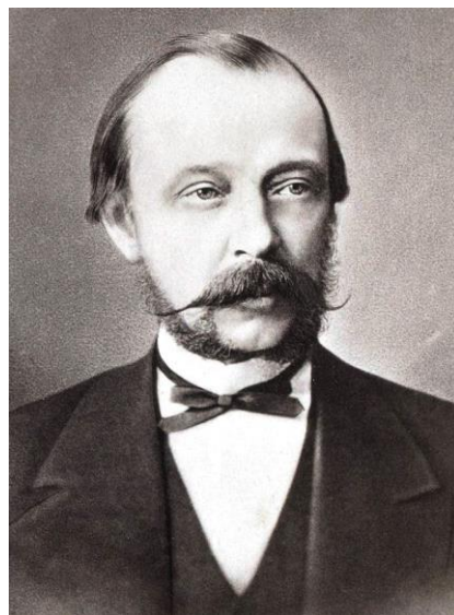
граф Дмитрий Андреевич Толстой

В «Правилах для учеников гимназий и прогимназий ведомства министерства народного просвещения», утверждённых в 1874 г. министром народного просвещения графом Дмитрием Андреевичем Толстым (1823–1889), эта цель сформулирована следующим образом: