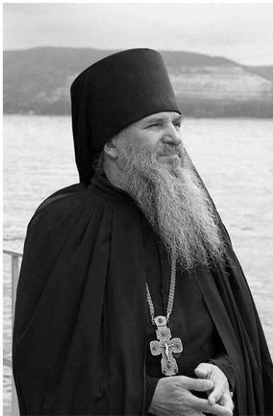
архимандрит Георгий (Шестун)

Ещё в 1995 г. священник Евгений Шестун (позже архимандрит Георгий), единственный в нашей стране доктор педагогических наук в священном сане, разрабатывая