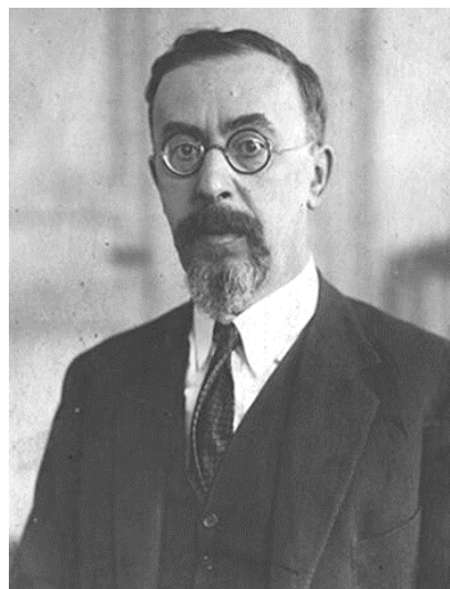
Семён Людвигович Франк

Этот вопрос можно сформулировать иначе: каким должен быть православный педагогический уклад как устоявшийся тип отношений между людьми? Уклад — это стилистика совместной жизни и деятельности взрослых и детей в границах педагогического пространства. Типы педагогических укладов бывают разными 31 , но признаками органичности (а не механического агрегата) обладает лишь православный соборный уклад.