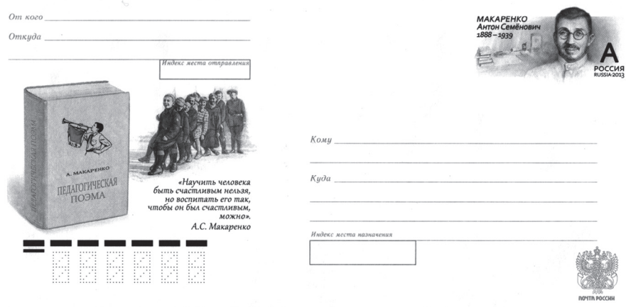
Конверт с портретом А.С. Макаренко

Похоже, что на государственном уровне 125-летие А.С. Макаренко отметило только учреждённое Правительством предприятие «Почта России», выпустившее маркированный конверт с портретом педагога.