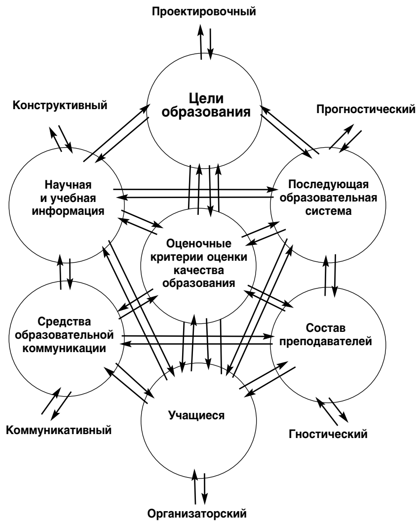
Рис. 2. Уточнённая модель взаимосвязи структурных и функциональных компонентов педагогической системы (по Н.В. Кузьминой)

простую структуру. Она разводит понятия структурных и функциональных компонентов: «Структурные компоненты — это основные базовые характеристики педагогических систем, совокупность которых, собственно, образует эти системы, во-первых, и отличает от всех других (непедагогических) систем, во-вторых» 6 . К ним принадлежат цели, учебная информация (содержание), средства педагогической коммуникации, педагоги и ученики. По мнению Н.В. Кузьминой, «названные компоненты необходимы и достаточны для создания педагогической системы. При исключении любого из них — нет системы» 7 .